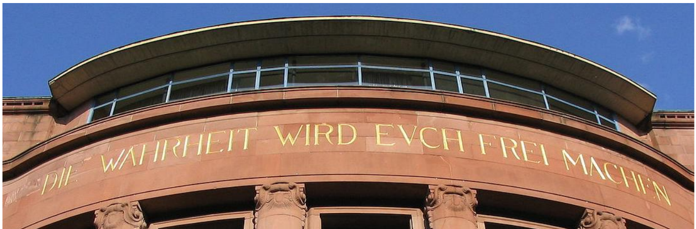
Aula der Universität Freiburg mit der Universitätsdevise nach Joh 8,3: „Die Wahrheit wird euch frei machen!“